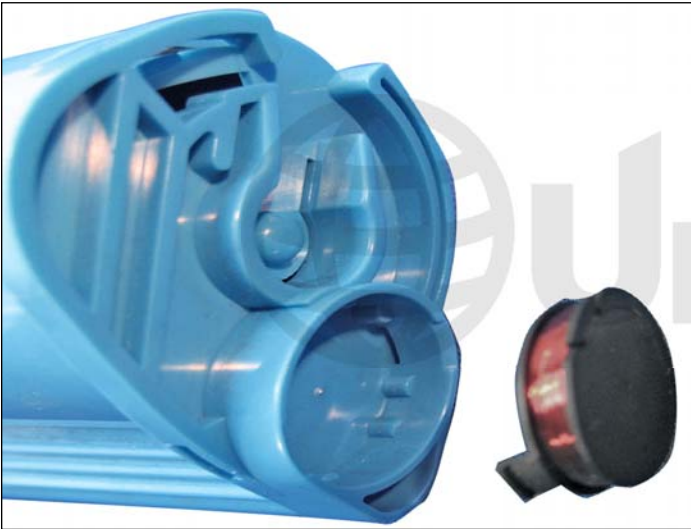
9. Colocar el chip UniNet de la manera que muestra en la foto.