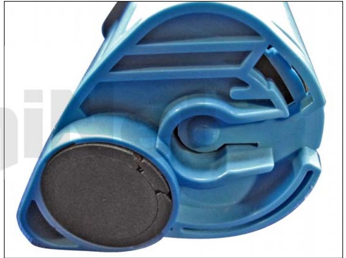
10. Clip colocado en la forma original.