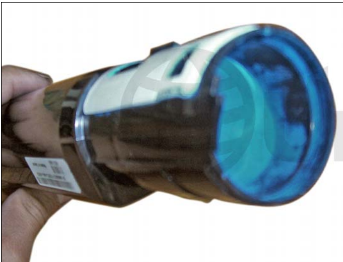
7. Este es el deposito de desecho del Revelador que tendrá que ser vaciado. En el fondo encontrará el tapón de carga del tóner. Retirar el mismo para limpieza y recarga.

NOTA: Mezclar el tóner con Revelador en la misma botella de tóner antes de rellenar el deposito de tóner.