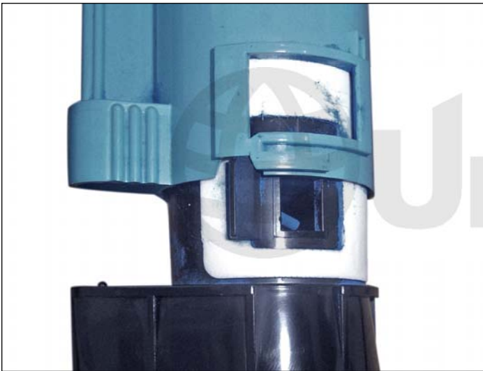
5. Empujar ahora la tapa hacia afuera del cartucho.