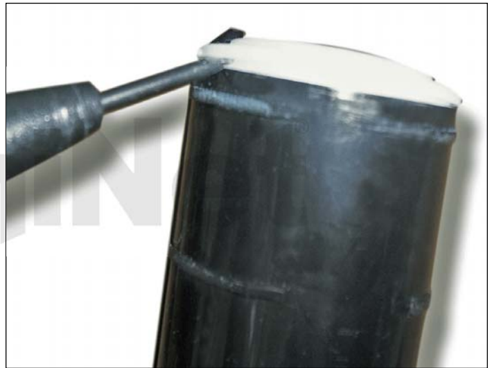
6. Retirar la tapa de carga del revelador.