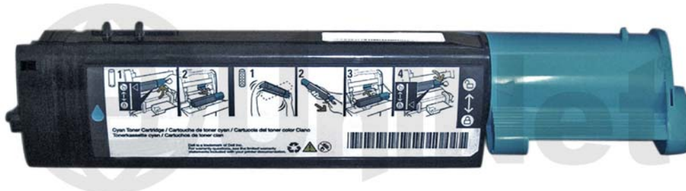
CARTUCHO DE TÓNER DELL 3000CN