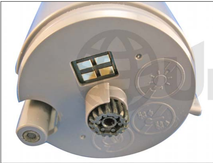
3. Fondo del cartucho mostrando su chip, engranaje del eje de agitación y boquilla de salida de toner