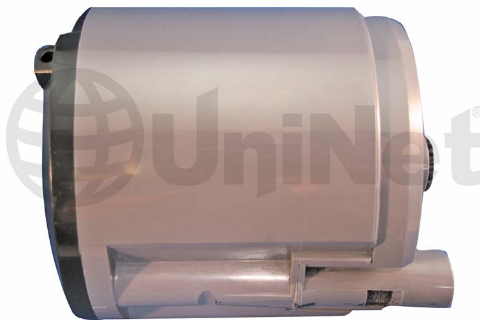
CARTUCHO DE TONER XEROX® PHASER 6110