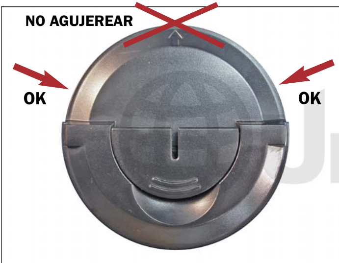
5. Para limpieza y recarga del cartucho con toner nuevo, se debe primero crear un orificio agujereando lateralmente como se indica en la foto. Luego se obtura el orificio con un sello autoadhesivo o con cinta de fuerte poder adhesivo.

NOTA: No agujerear sobre o cerca del borde superior del cartucho donde se encuentra apuntando la flecha.