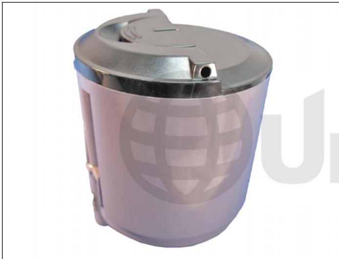
1. Cartucho Xerox Phaser 6110 mostrado con su tapa soldada.

El cartucho no es desarmable y su recarga se lleva mejor a cabo agujereando el cuerpo de una forma específica para proceder a su limpieza y recarga. El orificio practicado se obtura luego con un fino sello autoadhesivo.