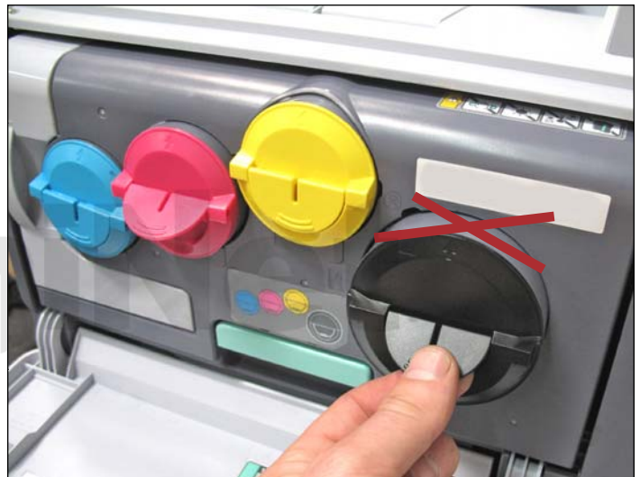
6. Notar la posición del cartucho ya en su módulo de imagen con la flecha hacia arriba. El espacio disponible en el domo es muy estrecho. Es importante no agujerear en cualquier parte de esta línea axial pues al insertar el cartucho se puede despegar el sello y como consecuencia causar eventuales pérdidas de tóner.

NOTA: No agujerear sobre o cerca del borde superior del cartucho donde se encuentra apuntando la flecha.