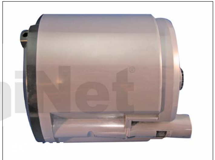
2. Vista lateral del cartucho de toner.